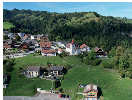
Blick auf Romoos